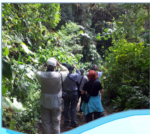
Día 1: Transición Paisaje Cultural Cafetero a Chocó Biogeográfico.

Ven a disfrutar de un viaje por la zona de transición del Paisaje Cultural Cafetero a la zona del Chocó Biogeográfico y los hermosos paisajes que circundan el Parque Nacional Natural Tatamá, entre los municipios de Apia y Pueblo Rico Risaralda. En esta aventura ingresarás a la majestuosa zona de inicio de páramo en la vertiente norte del Parque y conocerás uno de los mejores santuarios de observación de aves del país, como es la zona de Montebello y el Cerro de Montezuma. Además de conocer un bello municipio que es cuna étnica de comunidades afrodescendientes e indígenas Embera Chamí y los procesos que se desarrollan con la producción panelera y el cultivo de fique o cabuya. Todo esto y mucho más, durante 3 días.