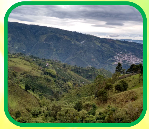
Día 3: Naturaleza, meditación y agroturismo por La Cumbre y Alta Campana.

Precios por persona: $1.057.200 - USD $330