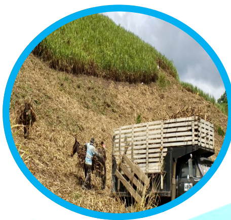
Día 2: Viaje por el Tatamá de Naturaleza Extrema (Zona Cálida a Templada)