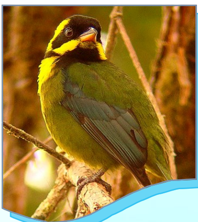
Día 2: Ascenso al Cerro de Montezuma (2.600 msnm) y observación de aves en Montebello.