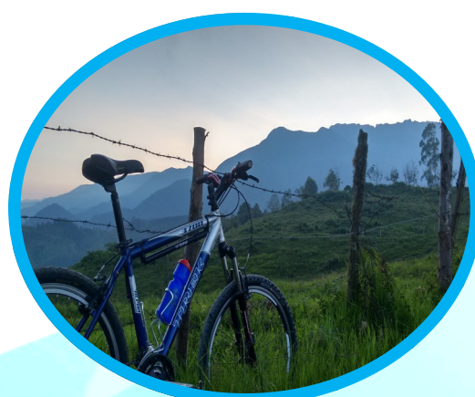
Día 3: Viaje por el Tatamá de Naturaleza Extrema (Zona Templada a Fría)

Precios por persona: $1.335.800 - USD $417