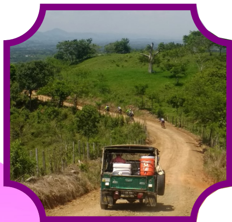
Día 1: Circuito turístico por el Valle del Risaralda y el filo de la Cuchilla del San Juan.

Toda la ruta es un derroche de paisajes, miradores y lugares extraordinarios como: bosques tropicales, cultivos de clima cálido y templado, experiencias culturales e históricas en Apia y Viterbo, Parapentismo, áreas protegidas y más de 10 miradores paisajísticos. Todo esto y mucho más, durante 2 días.