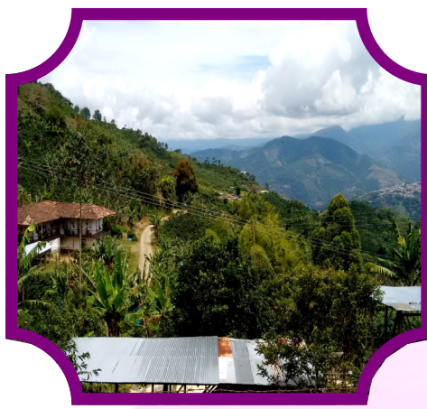
Día 2: Paisajismo, Parapentismo con aventura y cultura en Agualinda.