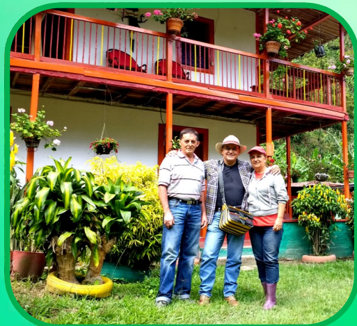
Turismo Cultural y de Tradición