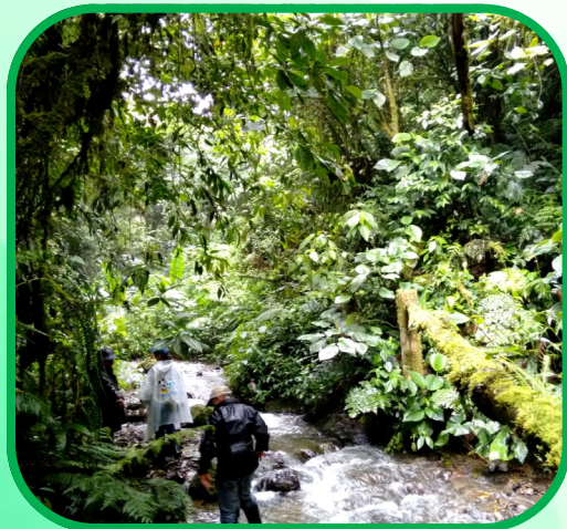
Turismo de Naturaleza