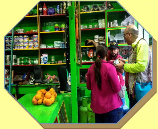
Día 1: Pueblo Tour Apia – Town Tour Apia.