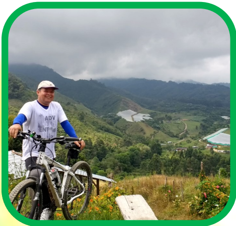
Día 1: Recorrido por la zona cafetera y la zona de amortiguación del PNN Tatamá.

Ven a disfrutar de un viaje por las vías, cultivos de café y paisajes que circundan el Parque Nacional Natural Tatamá, entre los municipios de Apia y Santuario Risaralda e ingresando a la majestuosa zona de cascadas y bosque altoandino del Parque, por la única vía de acceso posible, efectuando Trekking de media y alta montaña. Toda la ruta es un derroche de paisajes, miradores y lugares extraordinarios como ríos de agua limpia, bosques primarios, cañones profundos, zonas de cultivos de clima templado y frío, truchera, centros de visitantes, áreas naturales protegidas y lugares de ensueño. Todo esto y mucho más, durante 3 días..