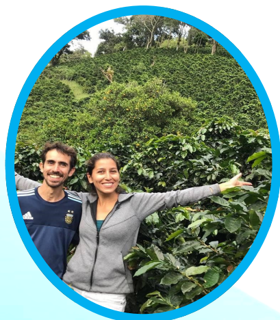
Día 1: Recorrido por la Cultura Cafetera Apiana.

Ven a disfrutar de un viaje por las vías, cultivos de café y paisajes que circundan el Parque Nacional Natural Tatamá. Toda la ruta es un derroche de paisajes, miradores y lugares extraordinarios como cascadas, ríos de agua limpia, bosques primarios, cañones profundos, zonas de cultivos de clima cálido, templado y frío, truchera, centros de visitantes, zonas de acceso al PNN Tatamá, áreas naturales protegidas y lugares de ensueño. Todo esto y mucho más, durante 3 días.