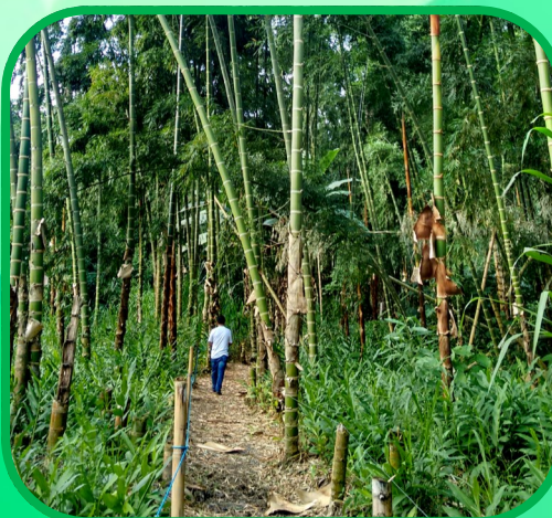
Turismo de Bienestar y Salud